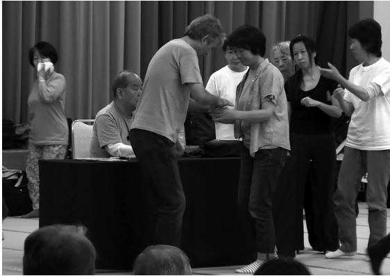
第17回UTA会セミナー風景